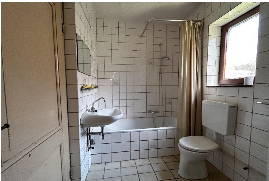
Badkamer | Kamer