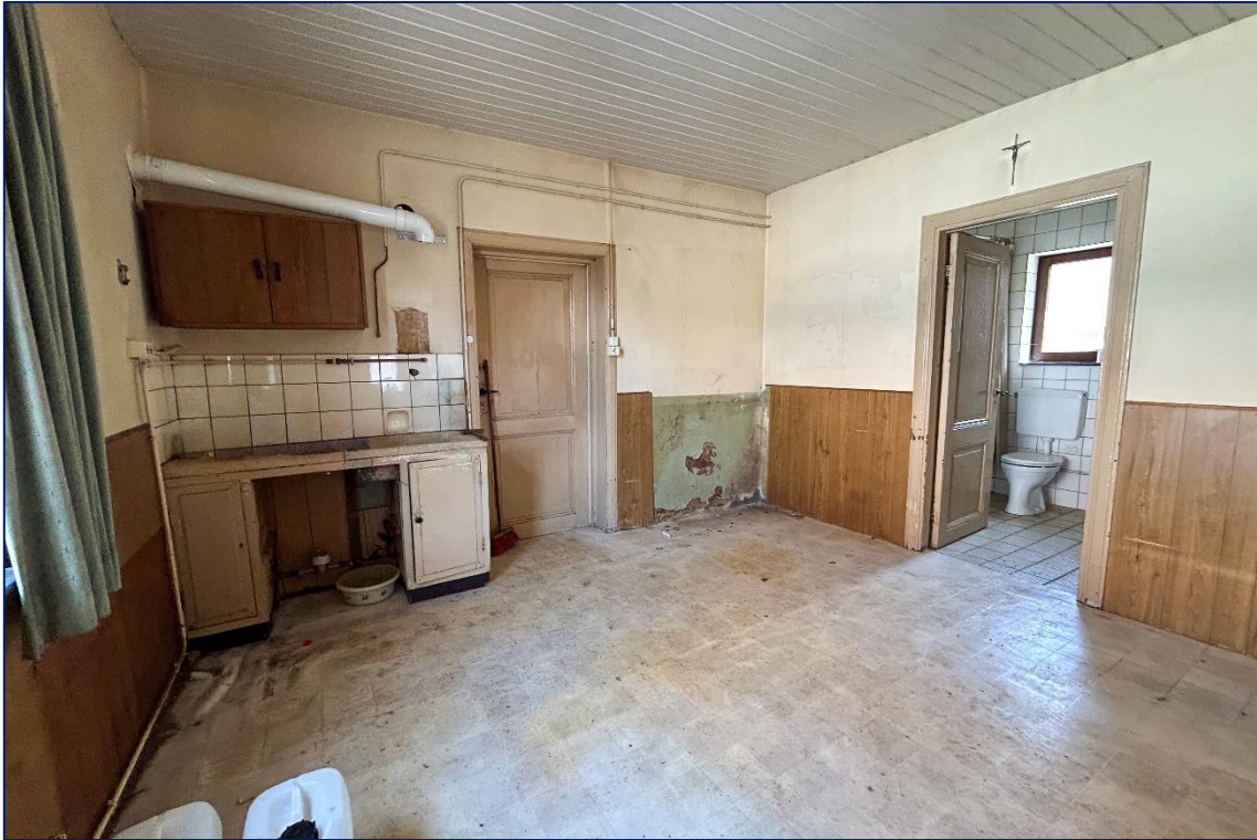
Leefkeuken | Badkamer