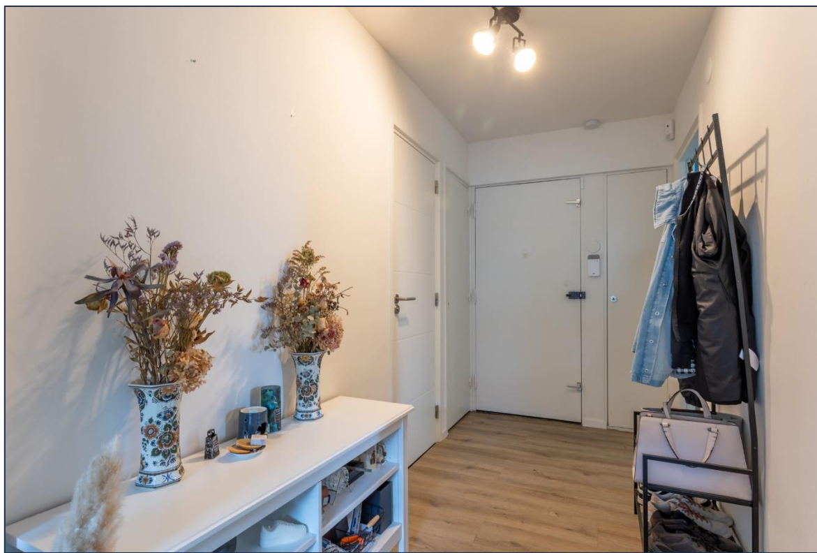
Hal | Toilet