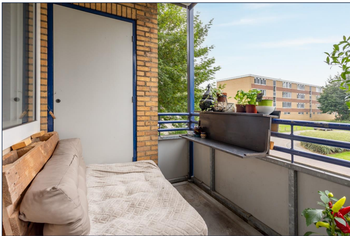
Balkon | Omgeving