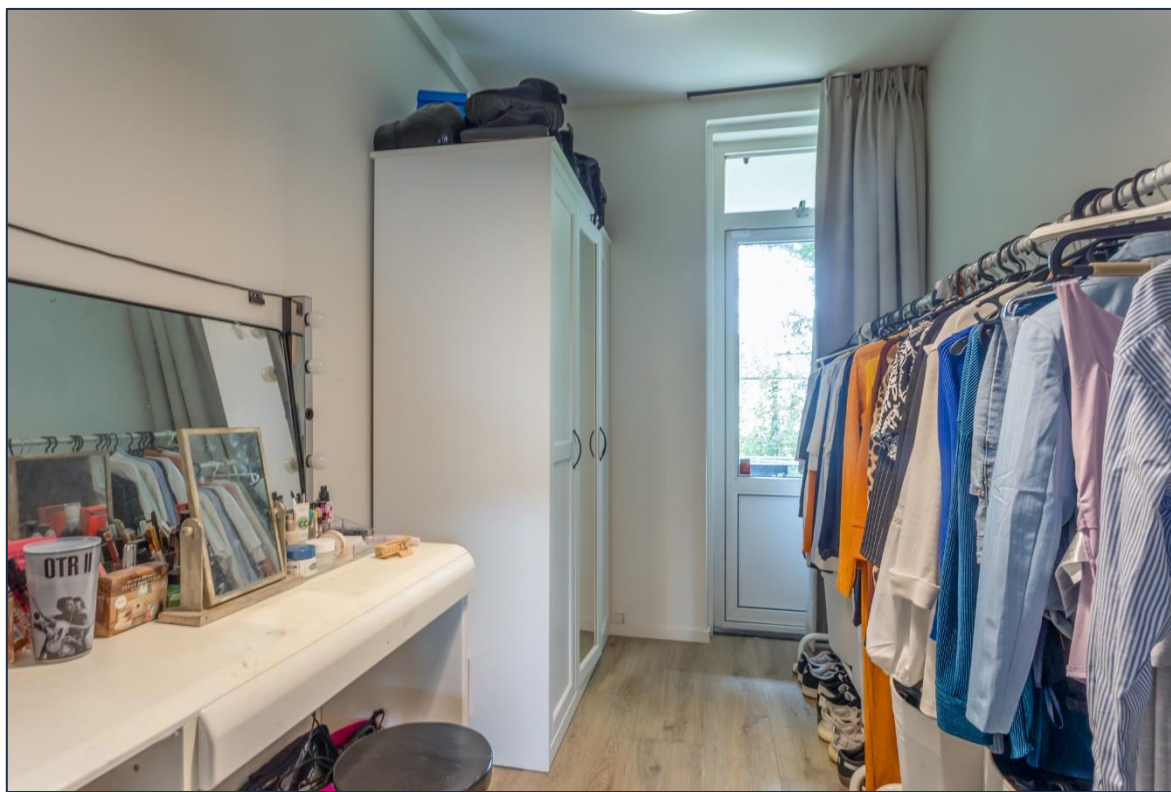
Slaapkamer | Balkon