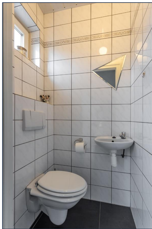
Overloop | Toilet | Woonkamer