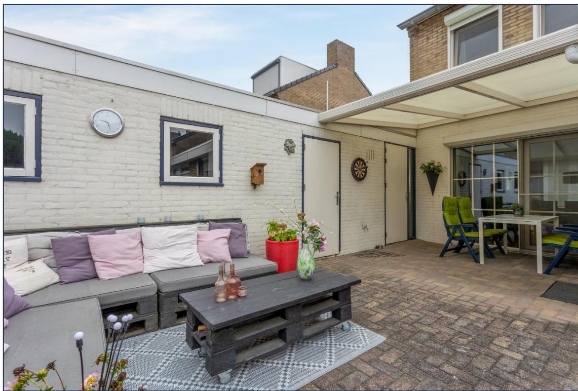
Tuin | Overloop