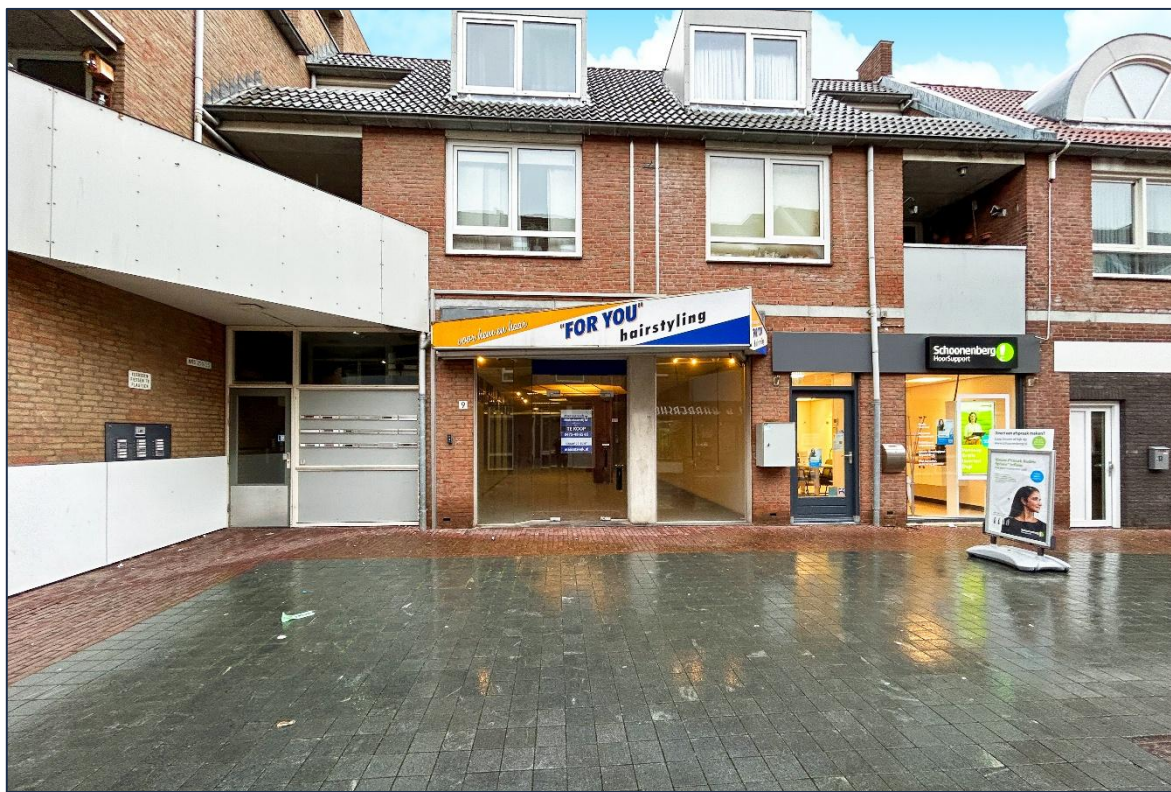
Voorzijde | Straatbeeld