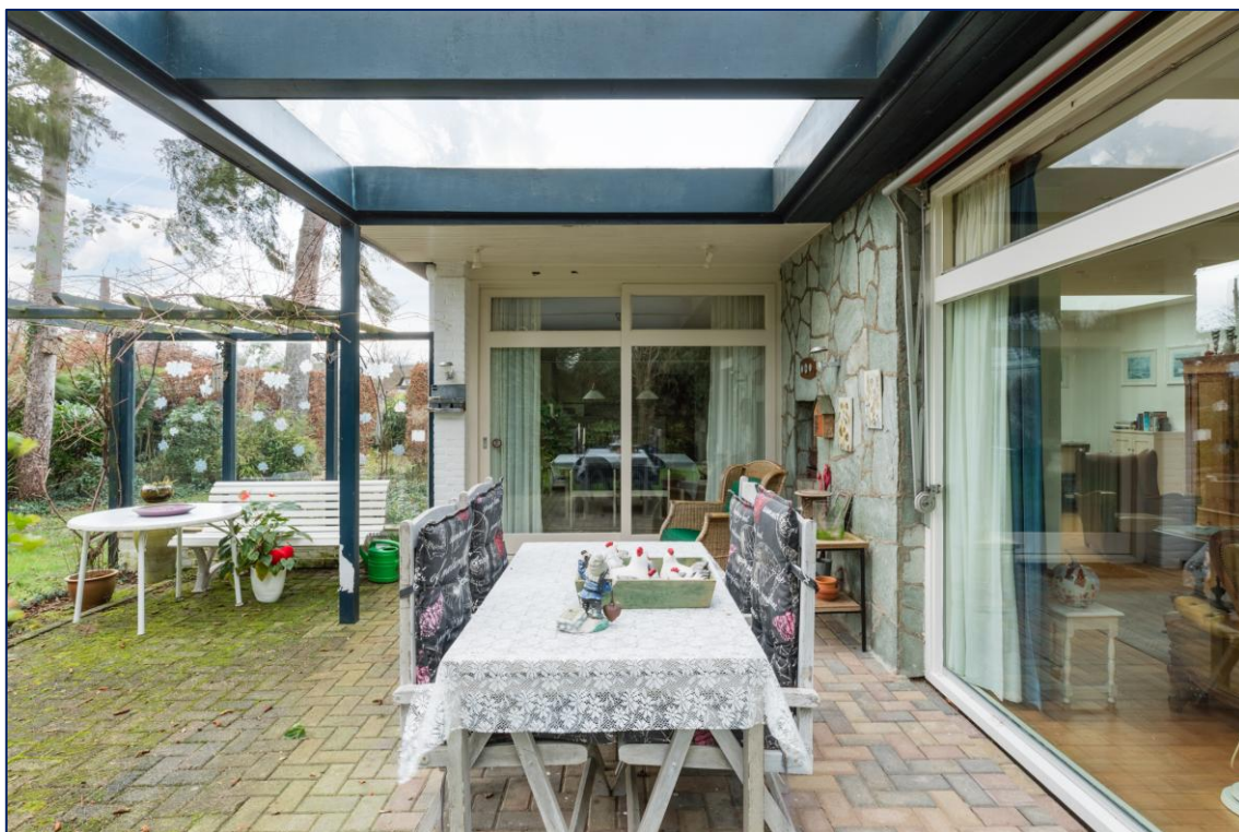
Overdekt terras | Tuin