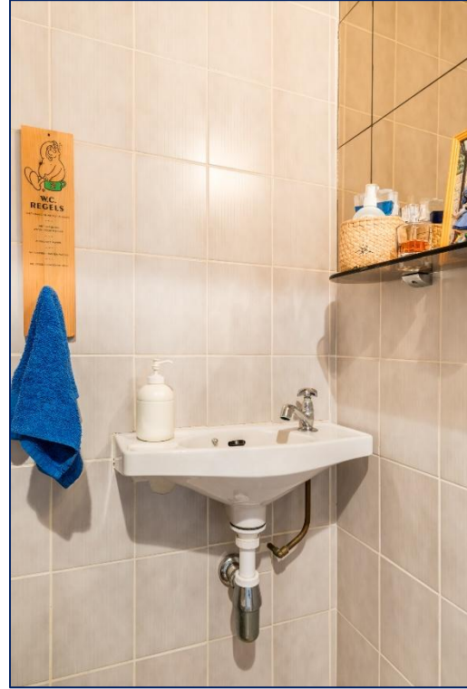
Toilet | Slaapkamergang