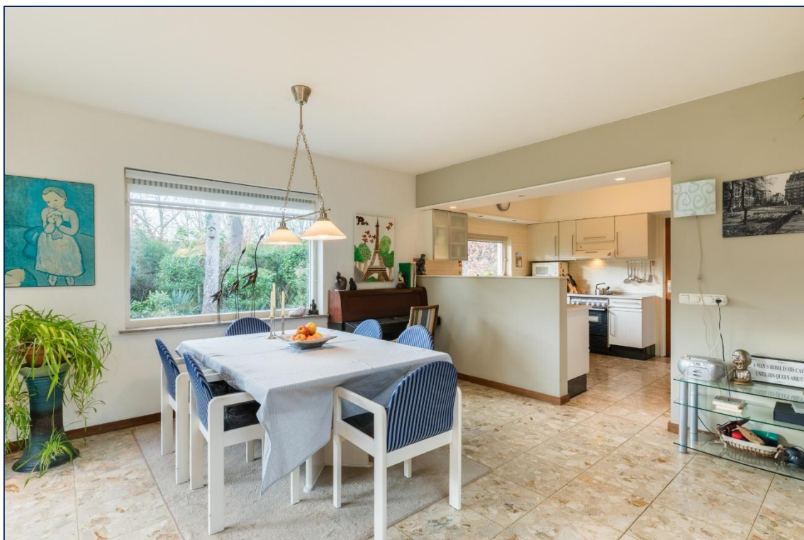
Eetkamer | Keuken