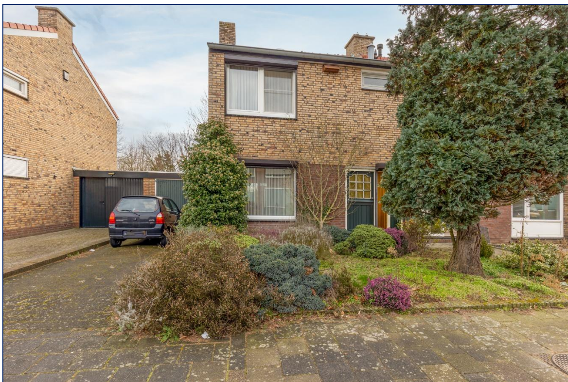
Voorzijde | Hal | Toilet