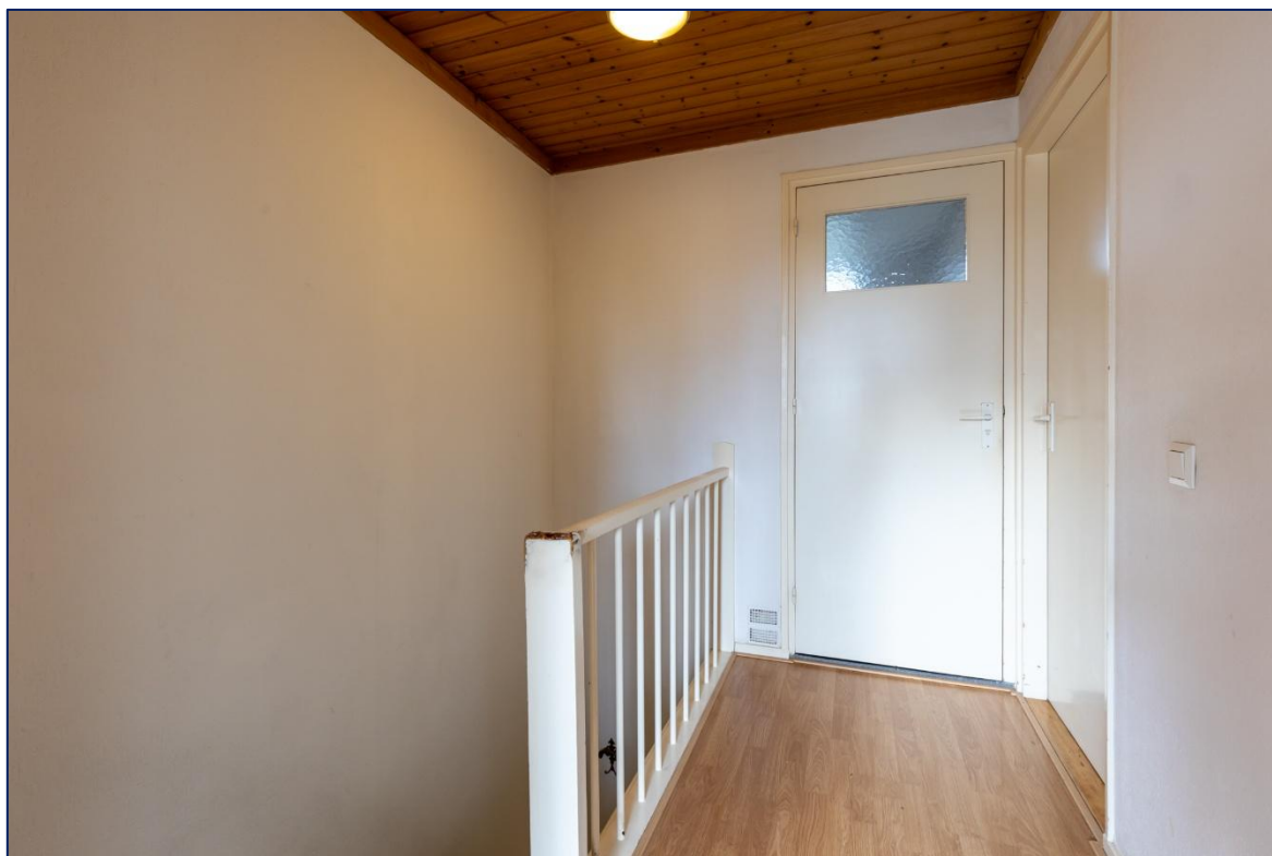
Overloop | Slaapkamer