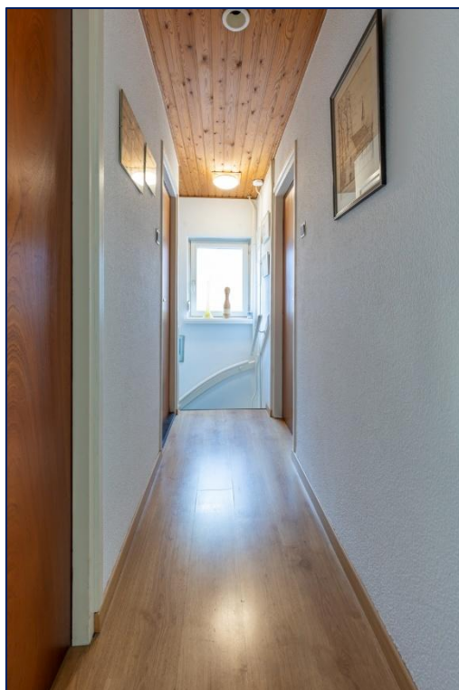
Overloop | Slaapkamer