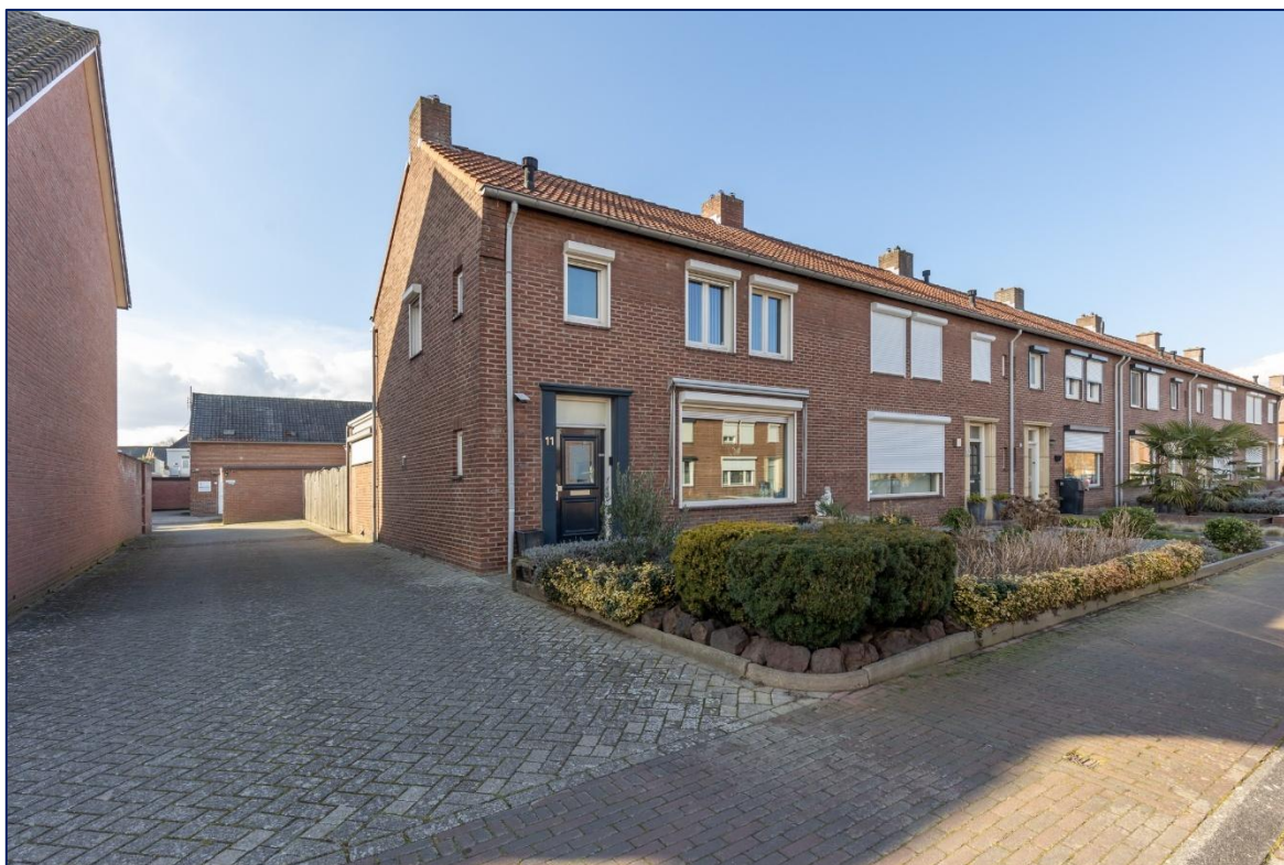
Voorzijde | Hal | Toilet