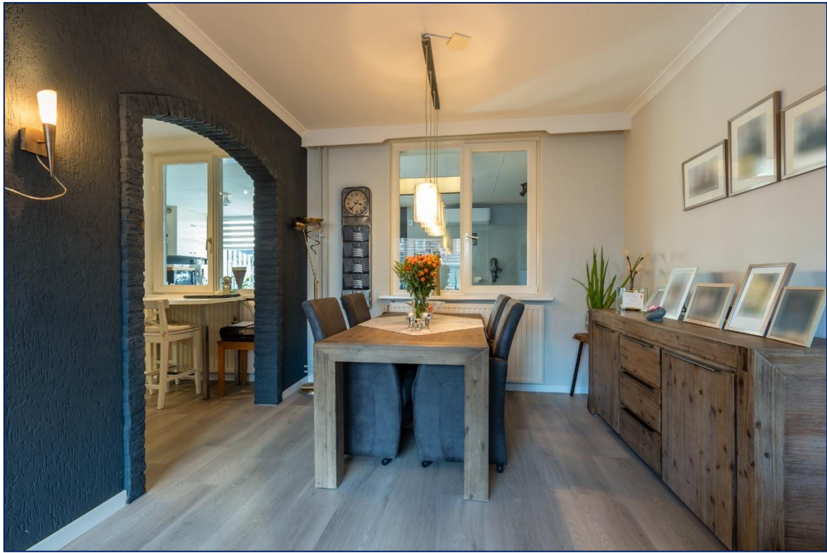
Woonkamer | Keuken