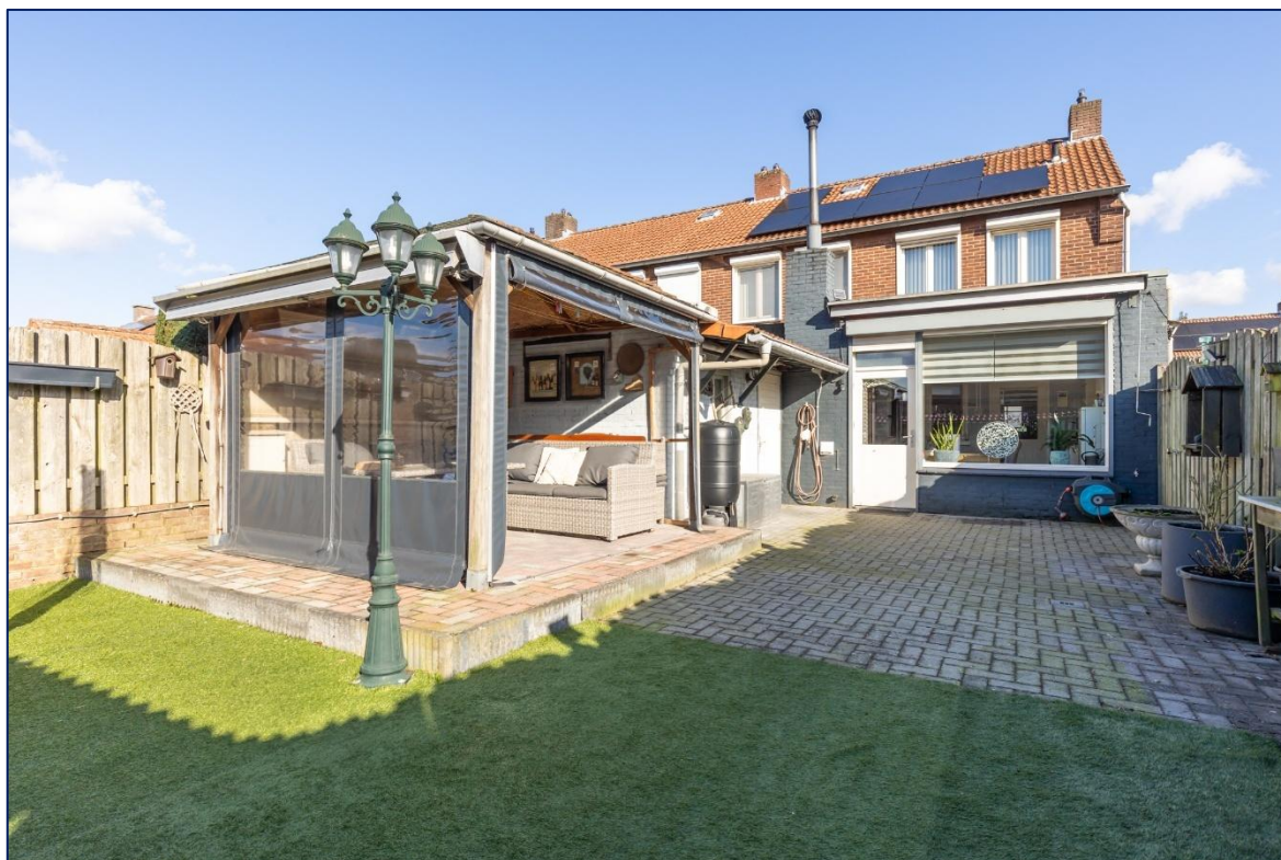
Achterzijde | Tuin