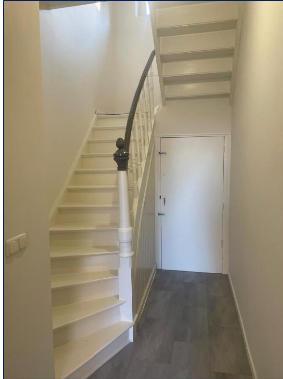
Hal | Woonkamer