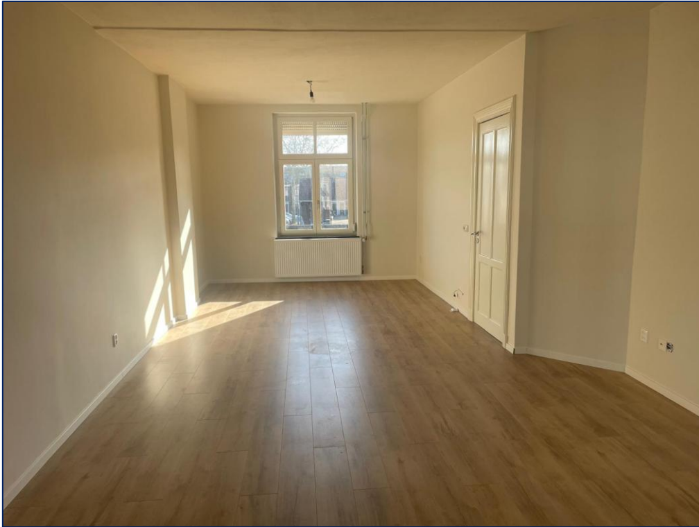
Slaapkamer | Badkamer