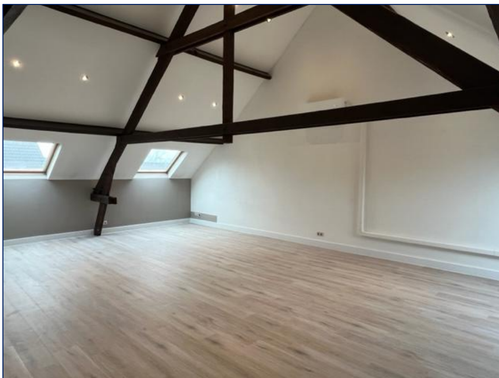
Woonkamer | Keuken