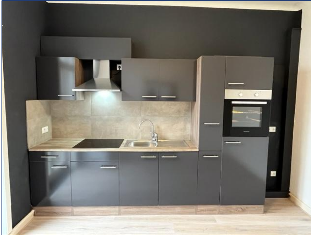
Keuken | Dakterras