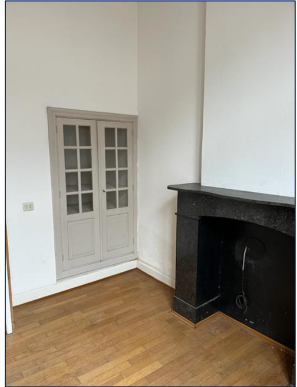
Woonkamer | Badkamer