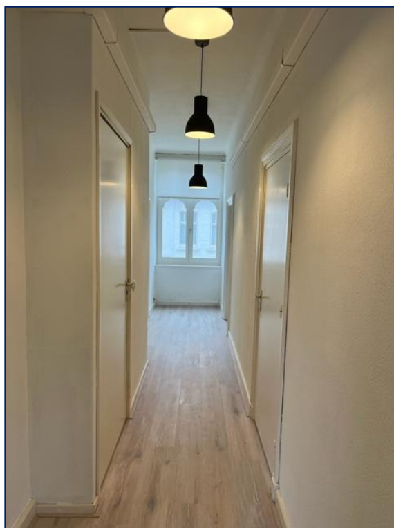
Gang | Slaapkamers