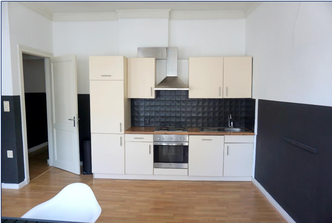
Keuken | Slaapkamer