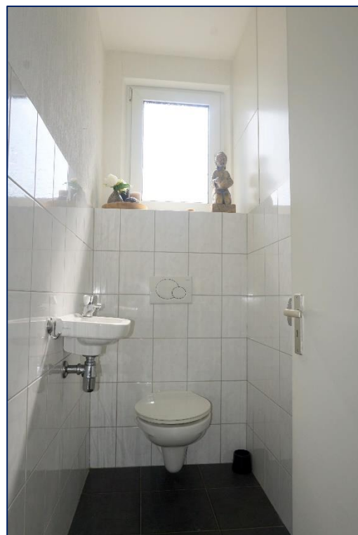
Gang | Toilet | Slaapkamer