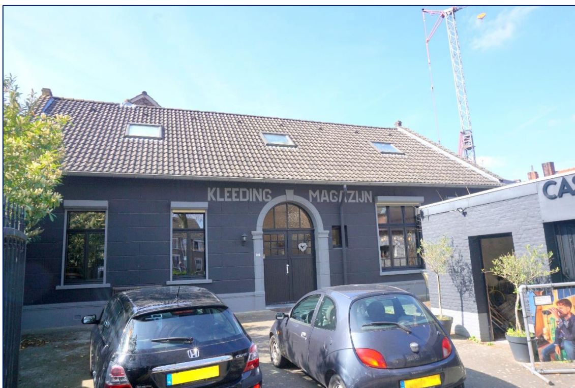
Ingang Graaf 116 Echt | Toegang 1 e verdieping