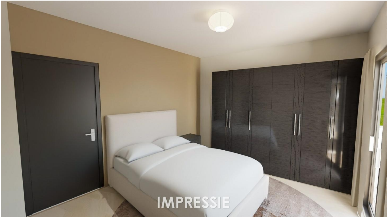
Slaapkamer | Bijkeuken