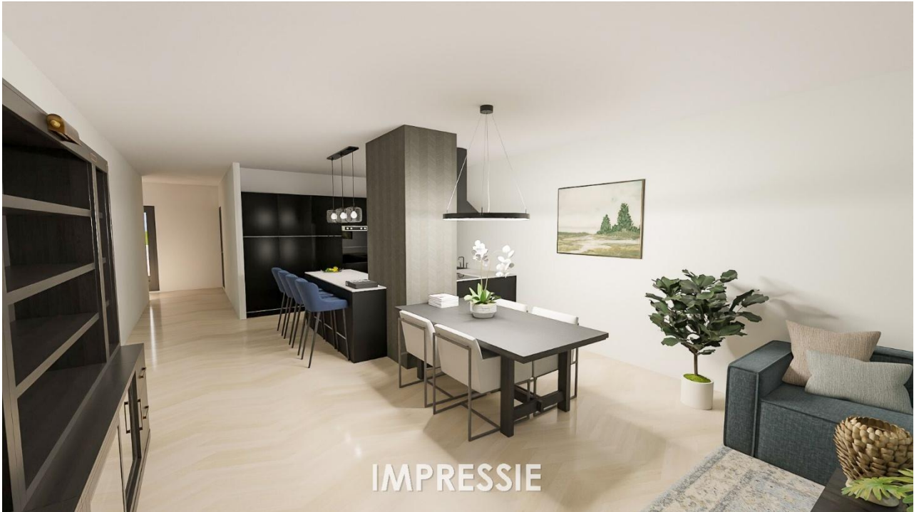
Woonkamer | Keuken