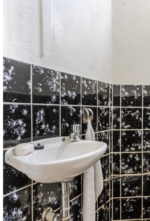
Toilet | Keuken