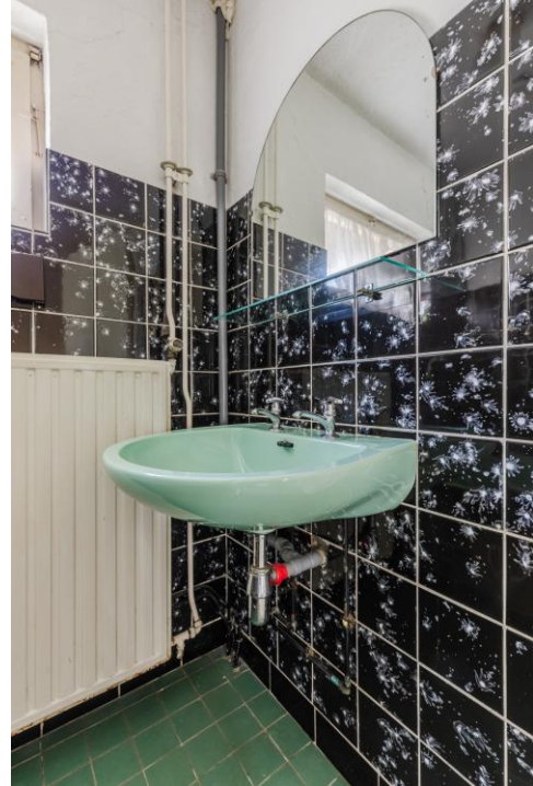
Badkamer | Zolder