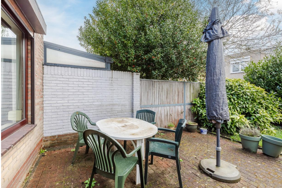
Terras | Tuin