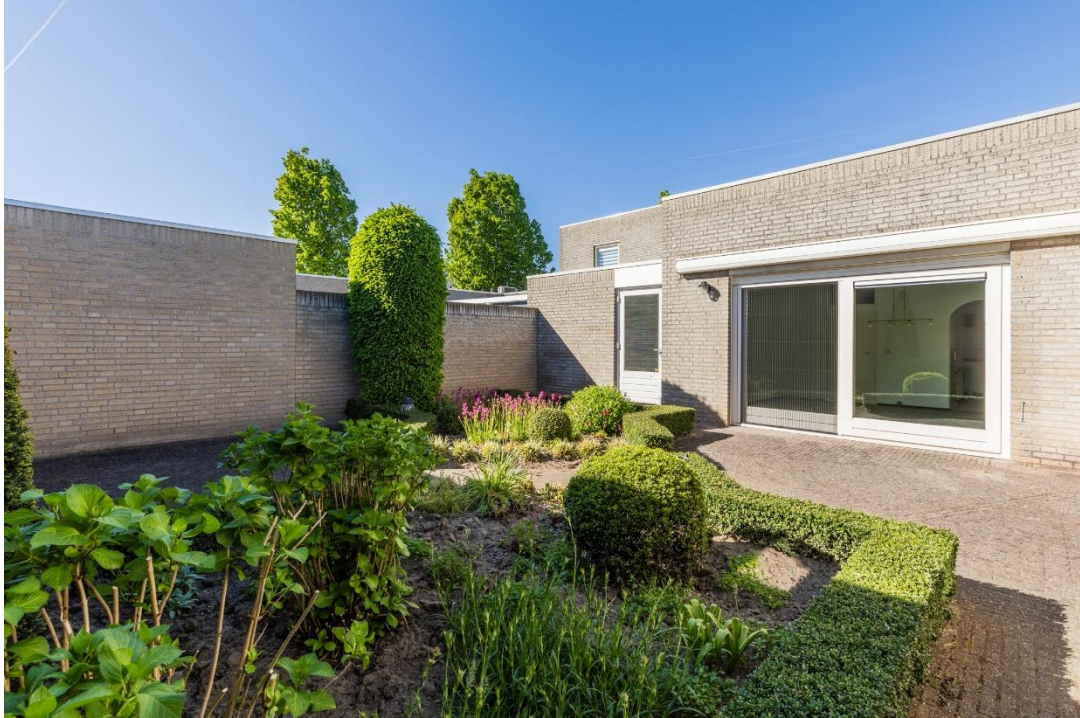
Achterzijde | Tuin