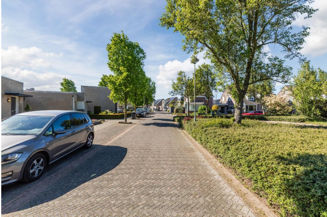
Ligging aan groenvoorziening