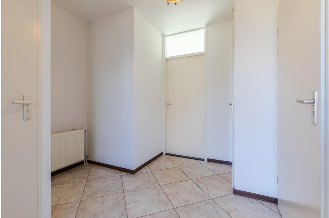
Hal | Toilet