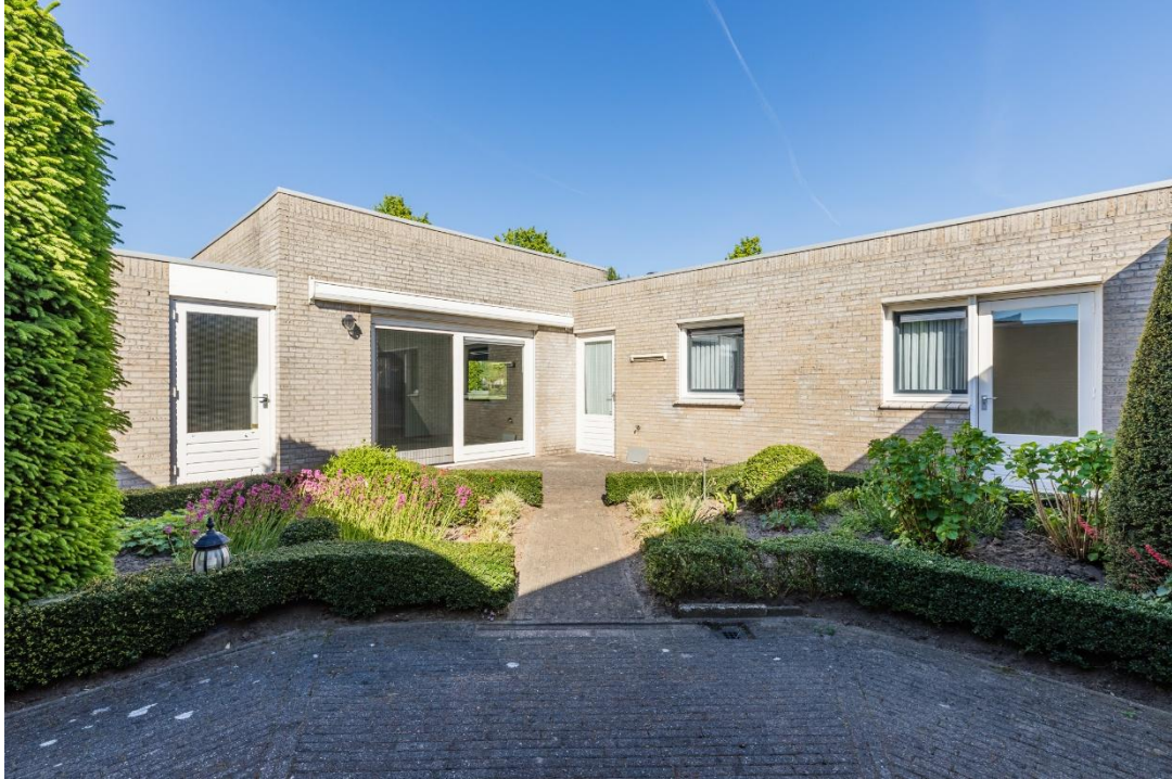
Achterzijde | Tuin