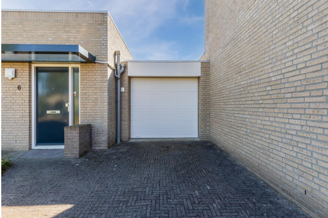
Garage | Entree | Hal