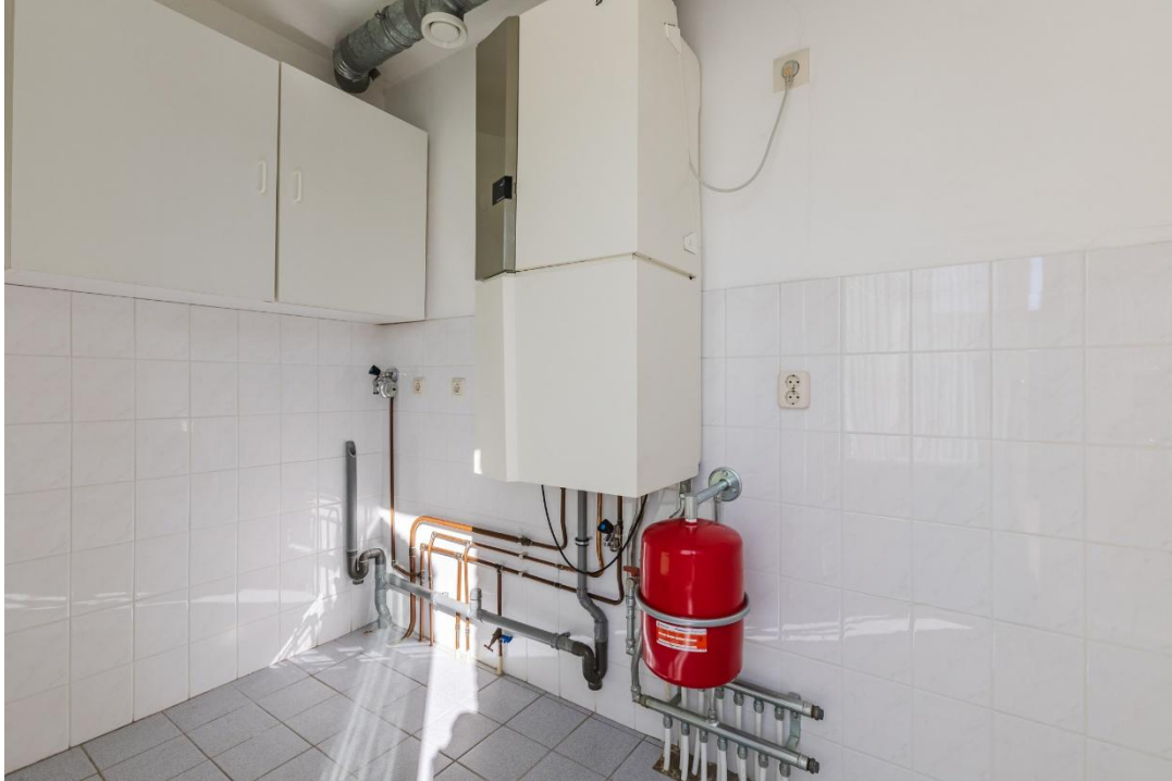
Bijkeuken | Gang