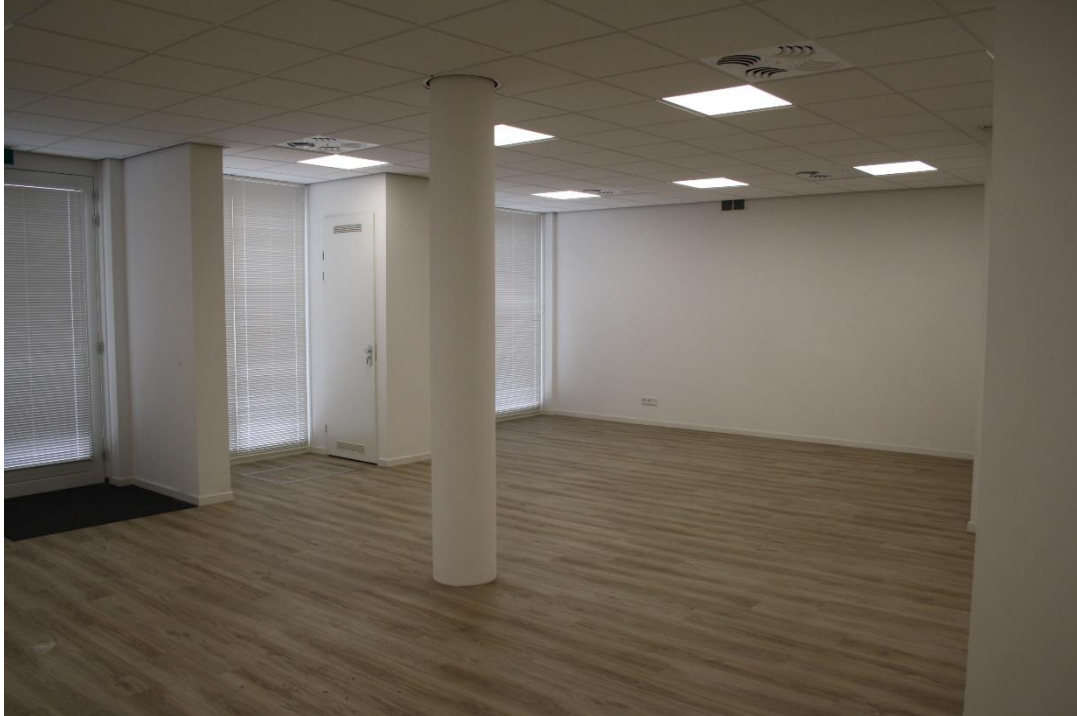
Kantoor-/praktijkruimte | Keuken | Toilet