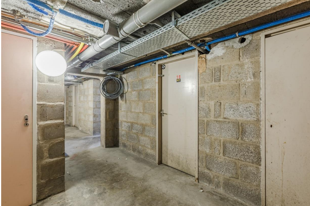
Berging | Uitzicht “Nieuwe Markt”