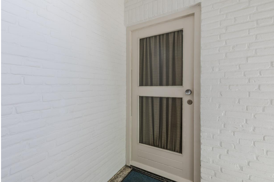
Voordeur | Hal